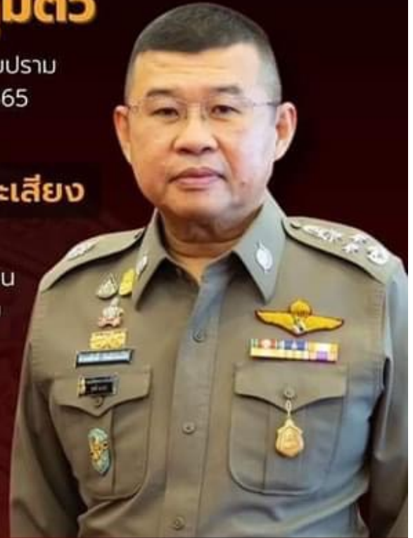
พล.ต.อ.ดำรงศักดิ์ กิตติประภัสร์ ผู้บัญชาการตำรวจแห่งชาติ

จัดเก็บรักษาข้อมูลจนกว่าคดีถึงที่สุด หรือขาดอายุความ แต่หากกระเบียด คณะกรรมการป้องกันและปราบปรามการทรมานและการกระทำให้นุคคล สูญหาย ที่จะกำหนดต่อไปกำหนดไว้อย่างใด ให้ดำเนินการตามนั้น