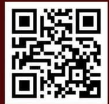
สแกน QR CODE ดาวโหลด เอกสารแจ้งแบบหนังสือกำจับ